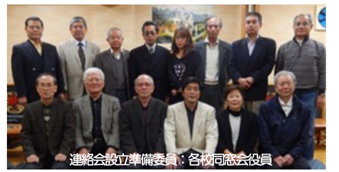
連絡会設立準備委員：各校同窓会役員

関西には奄美群島の各高校の同窓会が存在し活動しているが出身高校の枠を超えて交流、親睦を図ろうと昨年より準備を進めていたが、平成27年3月15日(日)に第1回設立総会を大阪市内で76名の参加で開催した。各会の会員が後進の支援や組織の活性化に向けた活動の意見交換などを行い有意義な連絡会を目指している。