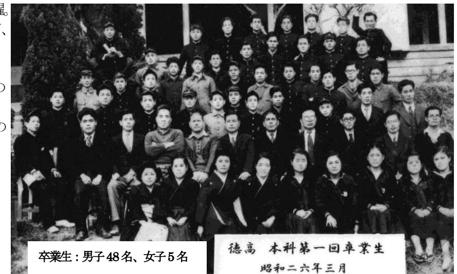
卒業生: 男子48名、女子5名

進学の状況 *日本本土に進学した者(11名) 熊本大学(医) 宮崎大学 大阪商科大学 明治大学 中央大学 日本大学 同志社大学 玉川大学(2) 鹿児島商科大学(2) *琉球大学に進学した者(11名) ・1名は 日本国への留学試験に合格し山形大学へ ・1名は米国テネシー大学大学院へ留学 ・昭28年奄美日本復帰時に4人は日本本土へ転学(早稲田大学 明治大学 静岡大学 鹿児島大学) ・琉大に残った5名も卒業後は本土に就職。 *密航で進学 ・昭和26年、本土で進学・就職するには、アメリカ軍政下の奄美から北緯30度の波濤をこえて命がけの渡航でした。進学した一人は鹿児島で留置され従兄叔父に身元引受人を依頼して解放されたとのこと。 ・英語学校卒7人・英語通訳認定書取得。語学は学問の武器。英語力が生きる支えになった。